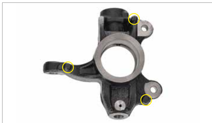
AIC Artikelnr.: 59438 | OE Vergleichsnr.: 1 474 288