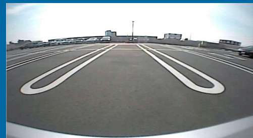
Bildwiedergabe bei Tageslicht